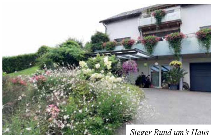
Sieger Rund um's Haus