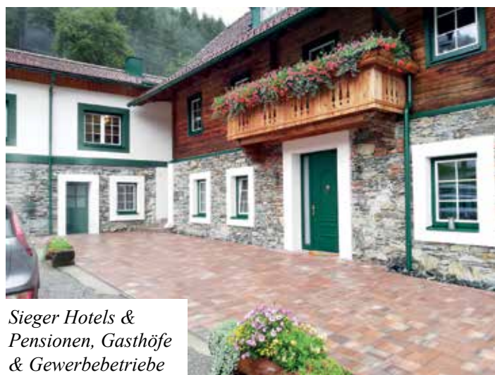
Sieger Hotels & Pensionen, Gasthöfe & Gewerbebetriebe

Garten als Erholungsraum: Gertraud Hinteregger