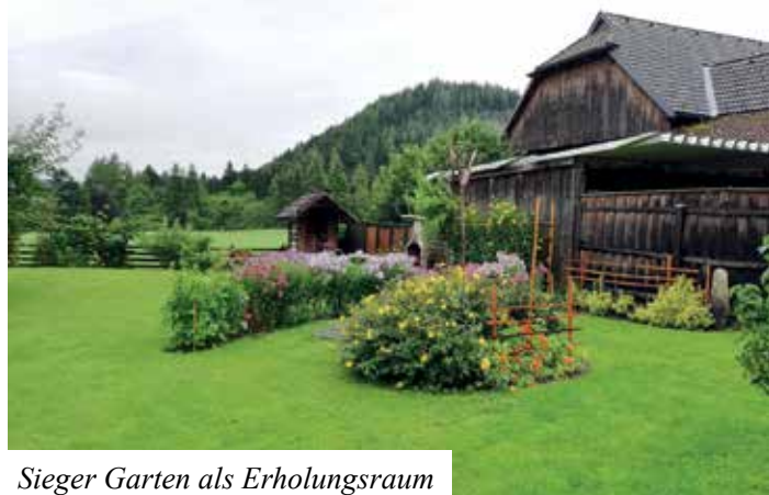
Sieger Garten als Erholungsraum