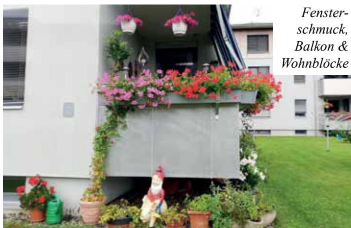
Fensterschmuck, Balkon & Wohnblöcke