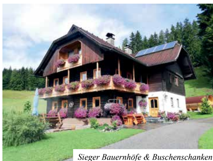
Sieger Bauernhöfe & Buschenschanken